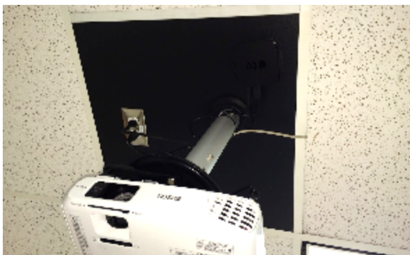
Projecteur, AppleTV et électricité sur une plaque de métal au plafond.